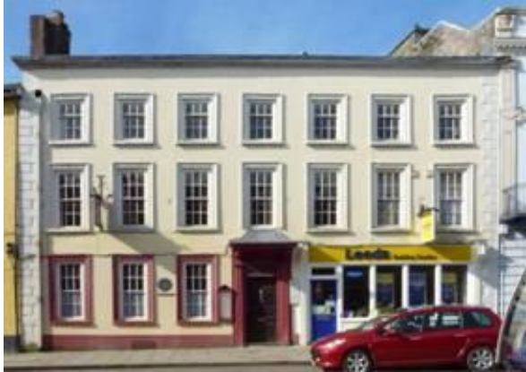
Tŷ Derw, Y Gwrthglawdd, Aberhonddu

Eglwys Ar Agor: Bydd y Cofrestri Plwyf ar gael at ddibenion ymchwil â gwirfoddolwyr wrth law i gynorthwyo ar ofyn. 10.00—4.00