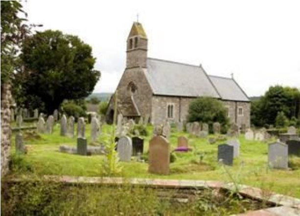
Eglwys Fair a Chynidr, Llangynidr