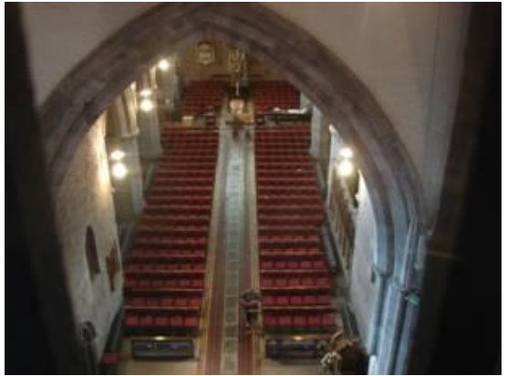
Cadeirlan Aberhonddu o Risiau'r Tŵr