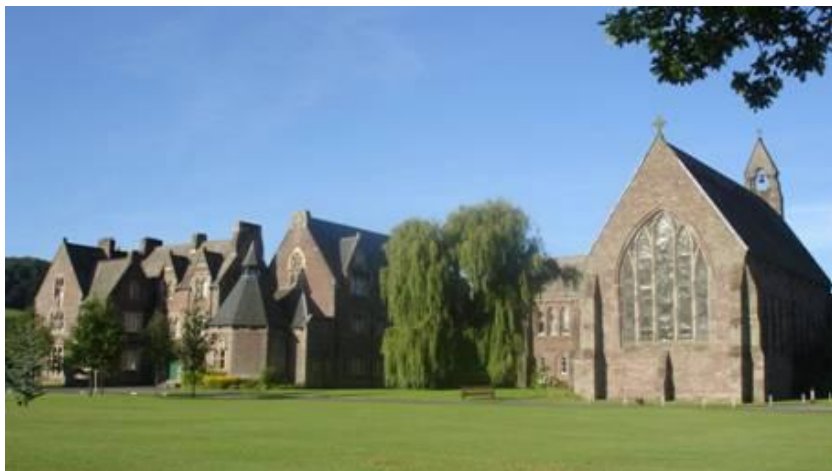
Coleg Crist, Aberhonddu