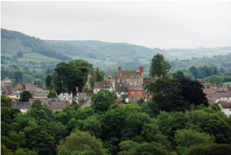
Tref y Gelli.

Sgrinio Ffilm: O 7.30pm Neuadd y Plwyf, Stryd Cantreselyf. Rhaglen Ddogfen Sianel 4 ynghylch Llofruddiaeth Armstrong gyda Deadly Advice yn dilyn. Ffilmiau graddfa 12+. Tocynnau wrth y drws.