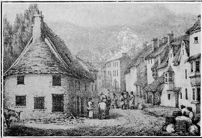
THE OLD TOWN HALL AND HIGH STREET, CRICKHOWELL

The Town Hall had a small court room, was used as a prison, and provided a Market Hall on the ground floor.